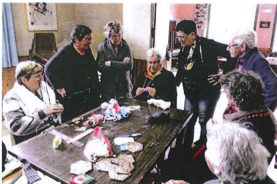
Activités à Issendolus

Siège administratif : rue principale – 46 120 LEYME Tel : 05/65/38/98/17 Fax : 05/65/38/99/94 Mail : association.segala.limargue@wanadoo.fr Site Internet : www.association-segala-limargue.fr