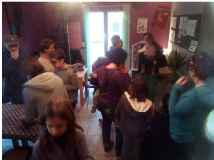
Après-midi ludothèque du 28 novembre

Toutes les idées que vous pourrez nous amener seront les bienvenues et des plus appréciées.