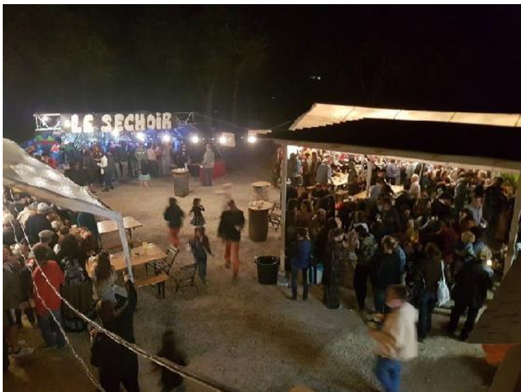
Fête de la soupe 4ème louche

Cela fait 4 ans maintenant que nous y organisons la fête de la soupe, qui chaque année attire de plus en plus de monde, avec en journée un concours de pétanque, un espace ludothèque, des contes pour enfants... suivi du fameux et tant attendu concours de soupe, qui régale les papilles des petits et grands. Tout ça en musique et dans la bonne humeur !