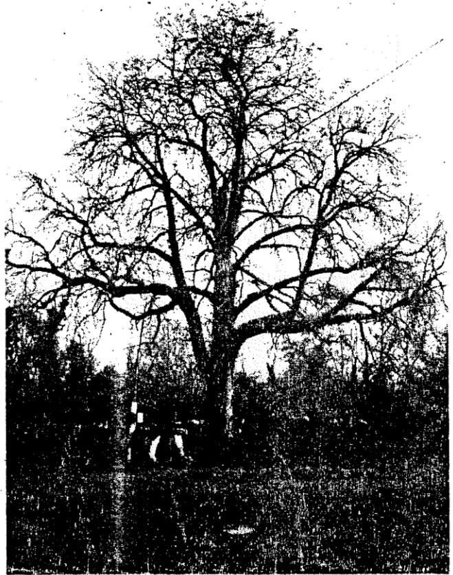
L'arbre de Gabaudet tendu vers le ciel comme un espoir sur la sagesse des peuples.

du causse, transformé en un centre de jeunes recrues, voulant s'engager dans la Résistance pour échapper au STO (service du travail obligatoire) était un coin tranquille où régnait la bonne humeur. Aussi, et c'est là une erreur colossale, les lieux n'étaient pas protégés et les Allemands n'eurent aucun problème pour assiéger le village. Ils assassinèrent des pauvres femmes innocentes. En tout, il y a eu quatre-vingts victimes et le village fut entièrement dévasté par les chars.