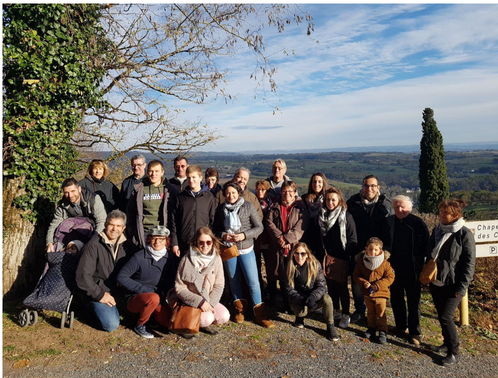
Photographie d'une partie des bénévoles, lors de la sortie le 24 novembre 2018.

Sur la journée du 24 novembre 2018 s'est déroulée une sortie à Brive-La-Gaillarde afin de remercier tous les bénévoles. De Turenne en passant par Collonges-la-Rouge pour une balade digestive se sont ensuivies plusieurs parties de bowling où, entre débutants ou joueurs confirmés, certains se sont découverts une vraie vocation ! La journée s'est terminée autour d'un bon repas au restaurant, occasionnant une réelle cohésion de groupe.