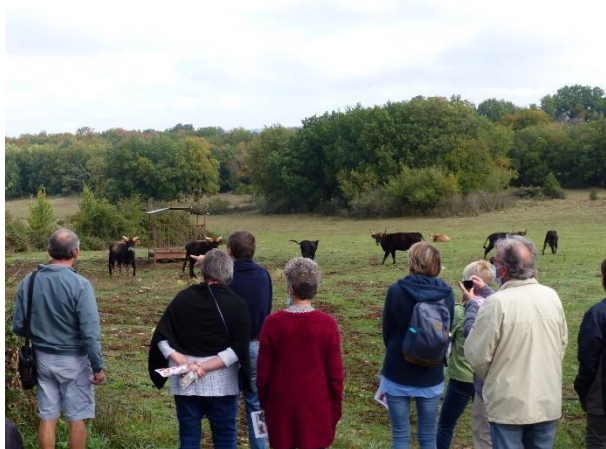
Visite de la ferme les Aurochs du Causse et Atelier cuisine le 23 et 24/09/2020